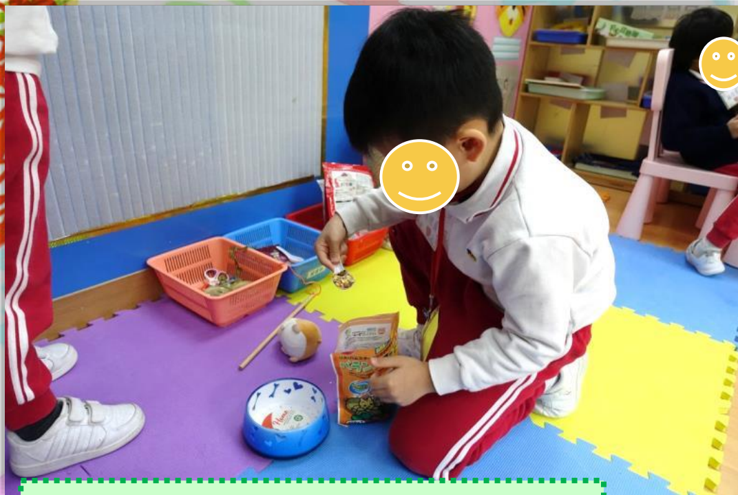
照顧動物，進行餵飼