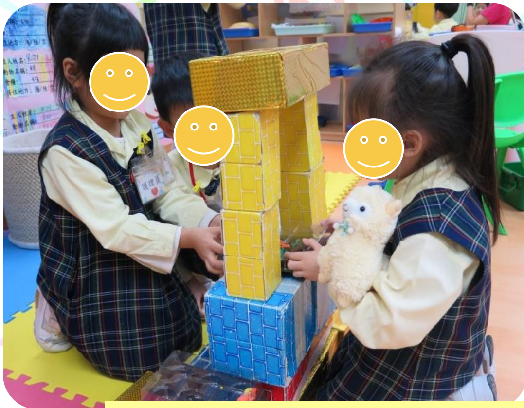
用低結構物料創設糧食小賣部

過程中亦不規限遊戲的玩法，讓幼兒多探索和想像，賦權幼兒親身去設計區角的內容來進行多樣化的遊戲。