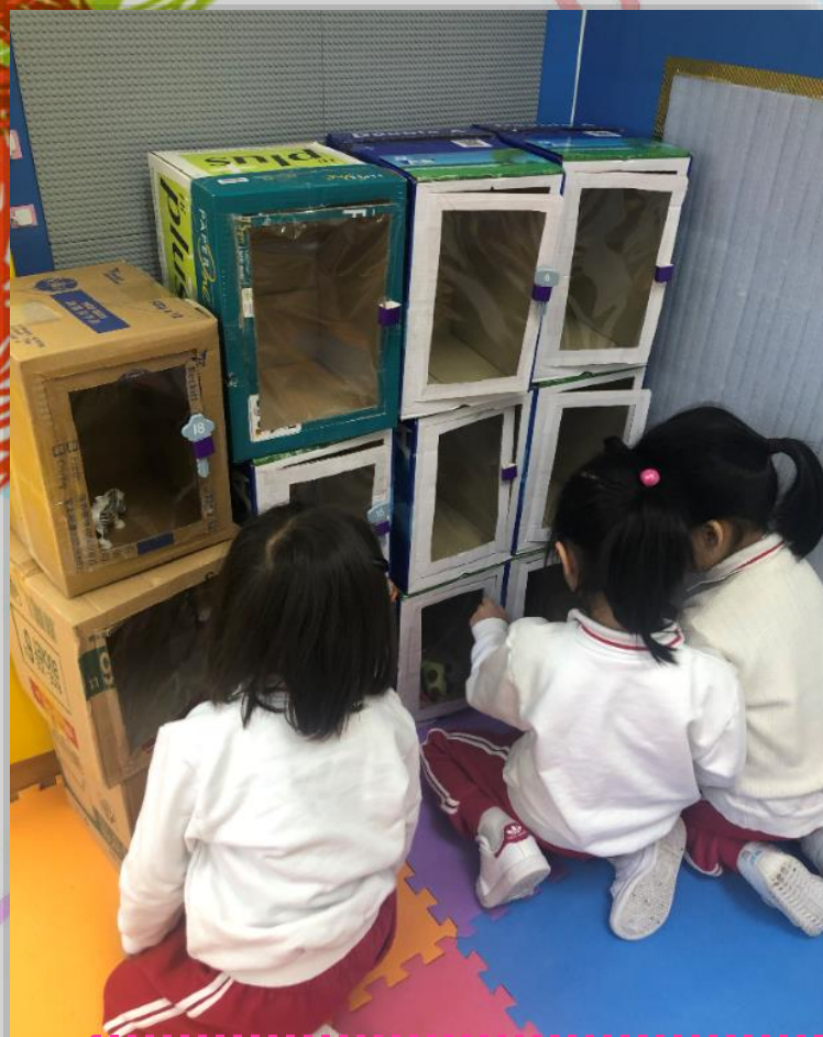
幼兒再將動物放入酒店房間