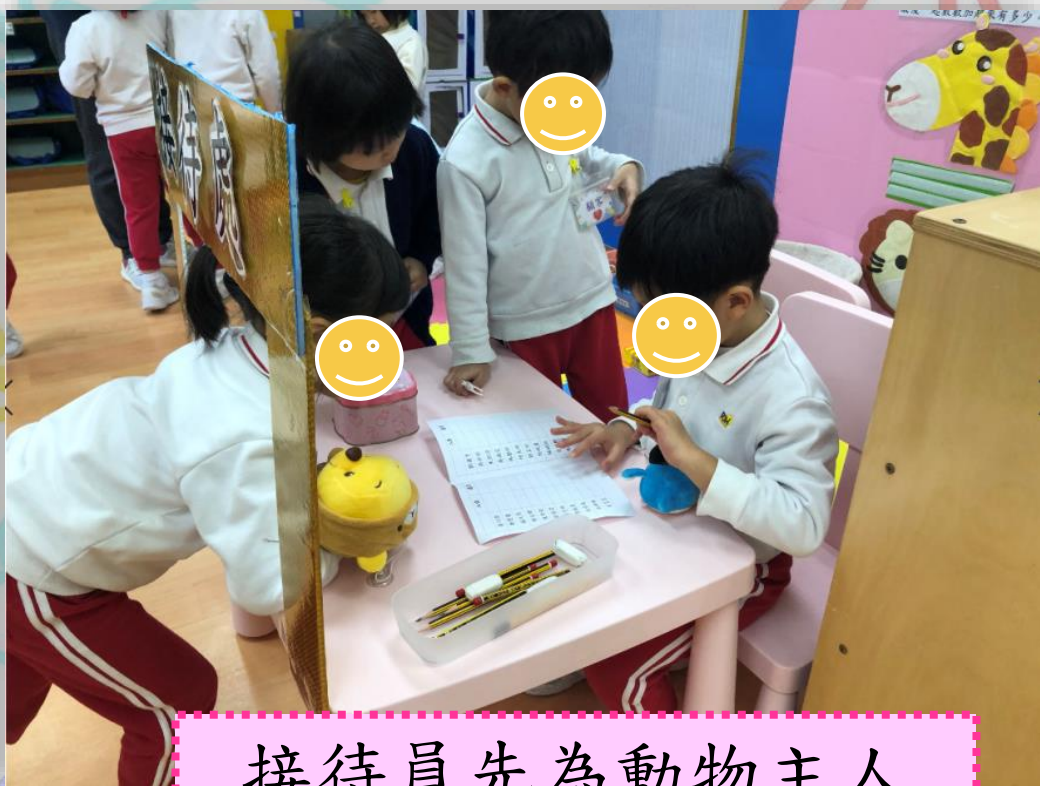
接待員先為動物主人 登記入住房間